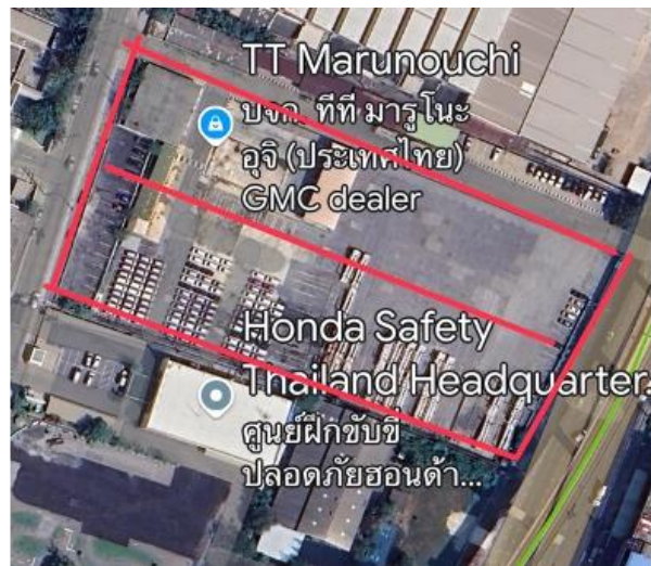
รูปแสดงแผนที่ดิน