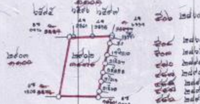
ตารางพื้นที่ที่ดิน