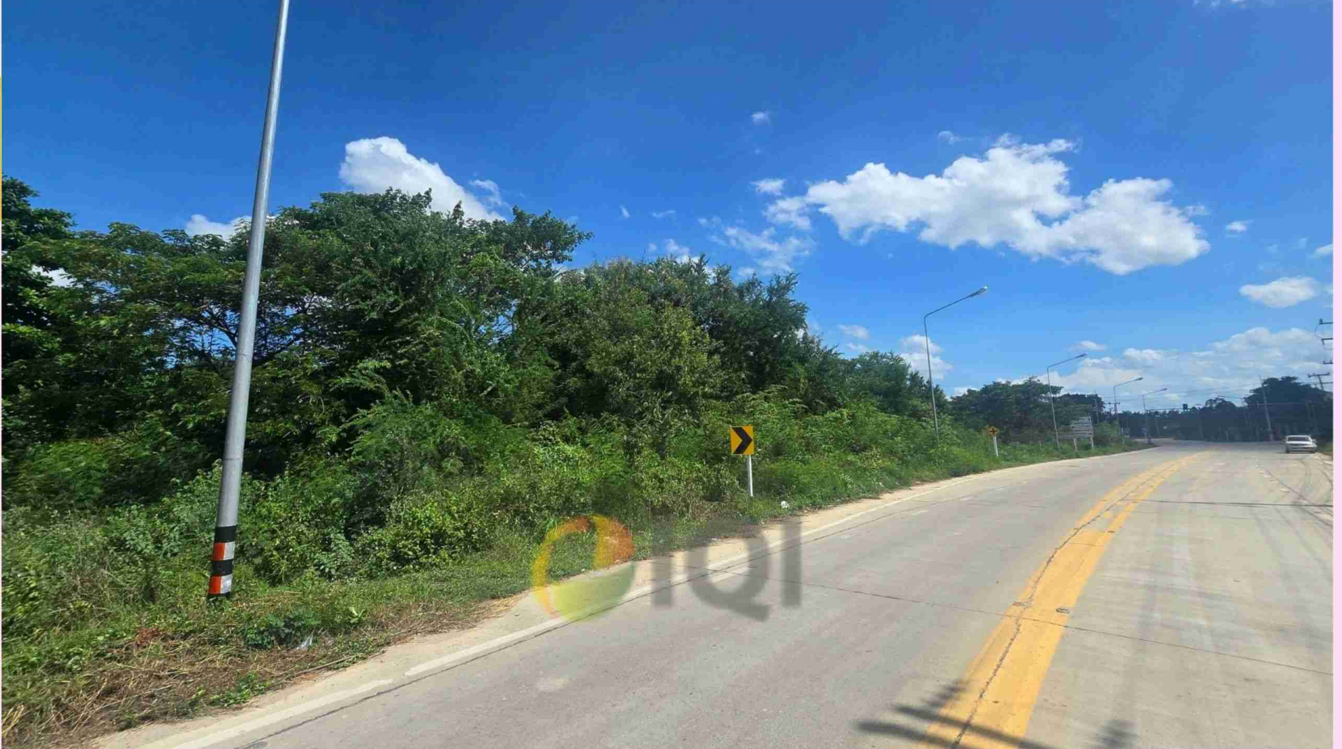
ที่ดินติดถนน หัวมุมสี่แยกหนองพรานพุก ต.ทับใต้ อ.หัวหิน